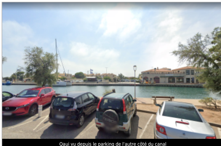
Quai vu depuis le parking de l'autre côté du canal