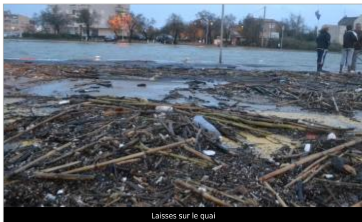
Laisses sur le quai

Méthode : GPS Référence nivelée : Marque d'inondation Système altimétrique : NGF IGN 1969 (système normal) Altitude de la référence (en m) : 1.050 m Altitude calculée de l'eau (en m) : 1.05