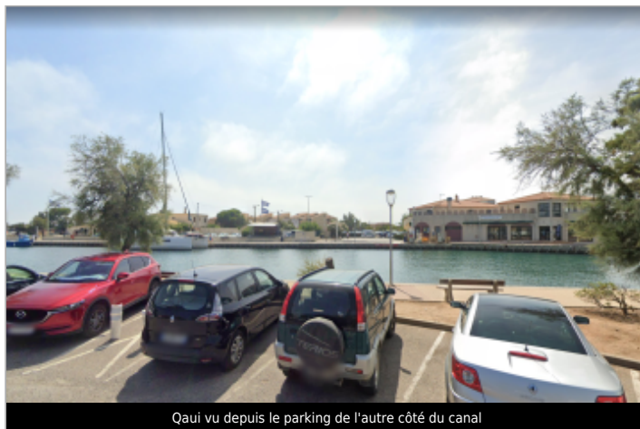
Quai vu depuis le parking de l'autre côté du canal