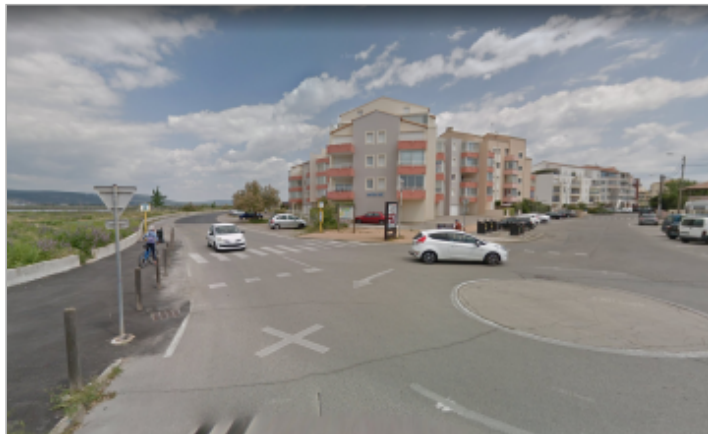
Entrée de l'avenue depuis le rond-point