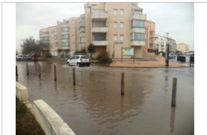
Entrée de l'avenue depuis le rond-point

Altitude calculée de l'eau (en m) : 1.05 m