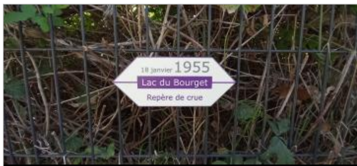
Repère de crue 18 janvier 1955