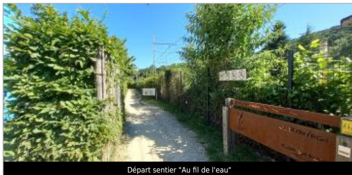
Départ sentier "Au fil de l'eau"

Coordonnées WGS84 : X: 5.89167380 / Y: 45.70997100