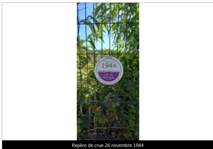
Repère de crue 26 novembre 1944

Altitude calculée de l'eau (en m) : 235.27 m