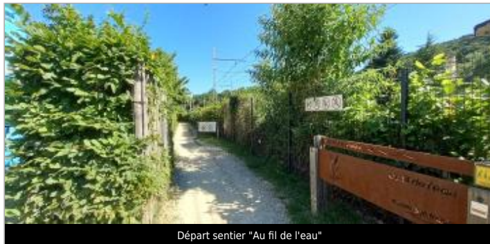
Départ sentier "Au fil de l'eau"