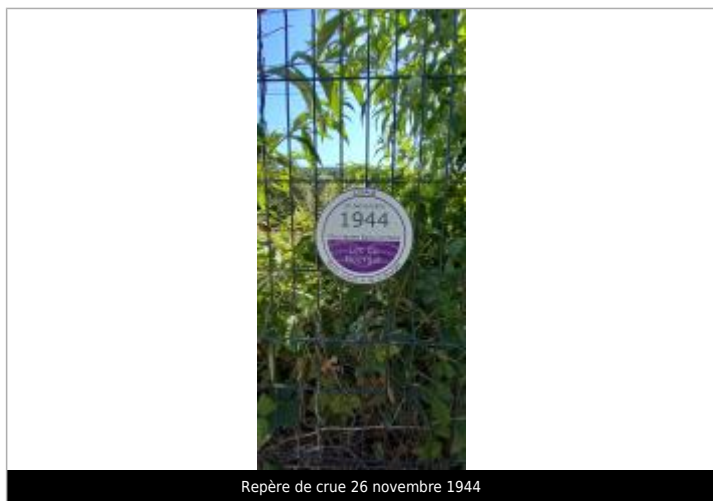
Repère de crue 26 novembre 1944

Altitude calculée de l'eau (en m) : 235.27 m