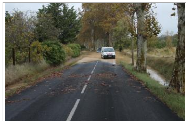
Laissez sur la route