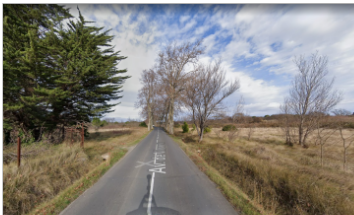
Avenue vue depuis le sud