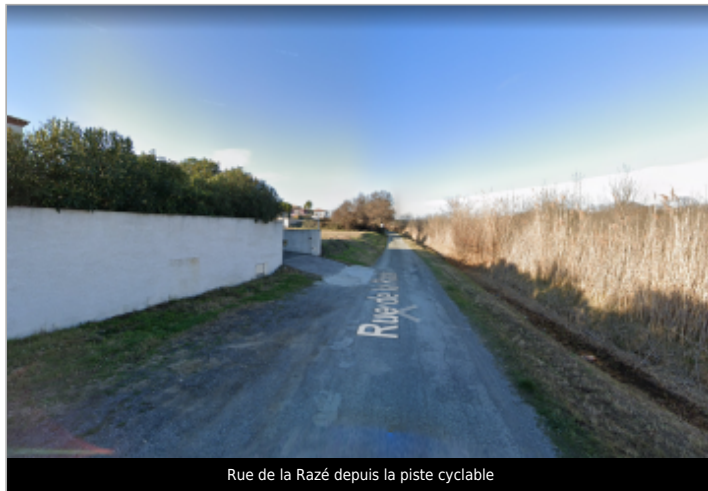
Rue de la Razé depuis la piste cyclable