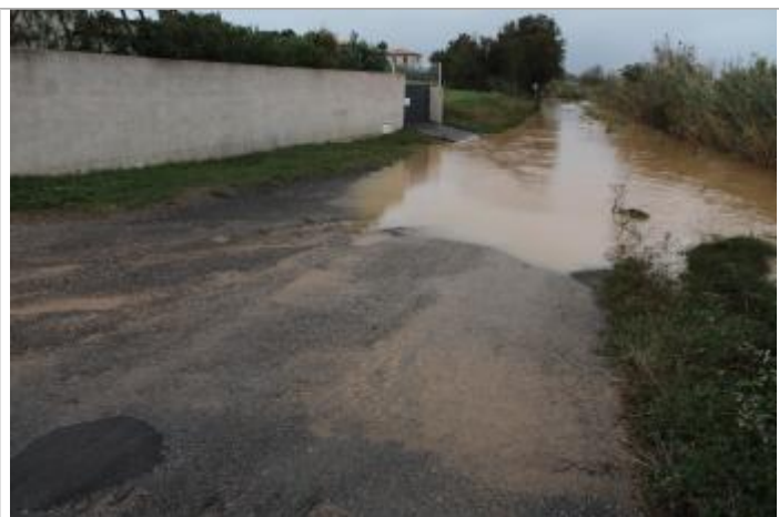
Rue de la Razé

Altitude calculée de l'eau (en m) : 2.8 m