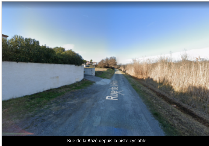
Rue de la Razé depuis la piste cyclable