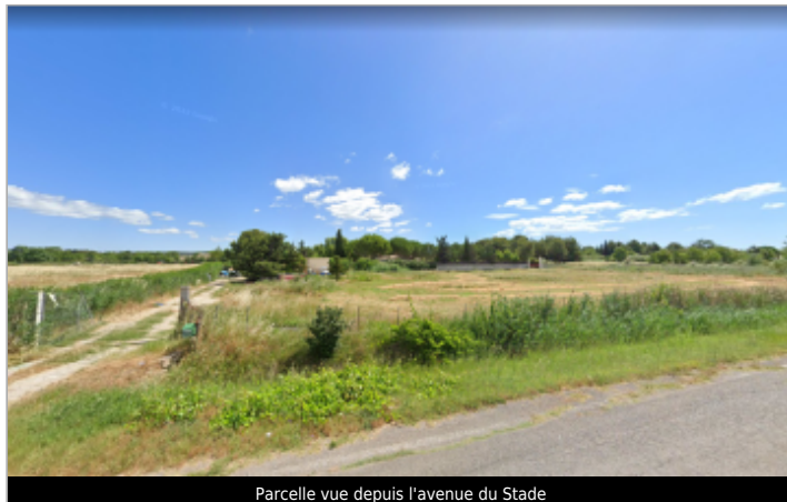
Parcelle vue depuis l'avenue du Stade