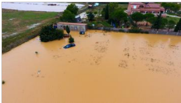
Vue aérienne de la parcelle

Altitude calculée de l'eau (en m) : 2.65 m