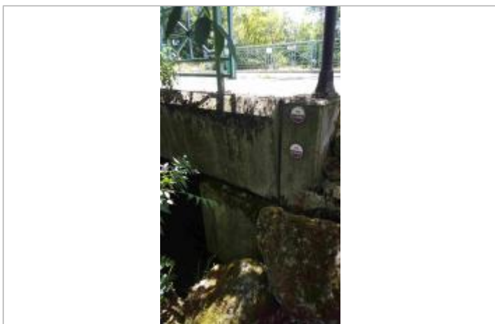
Repère crue 1994, pont route de pompierre