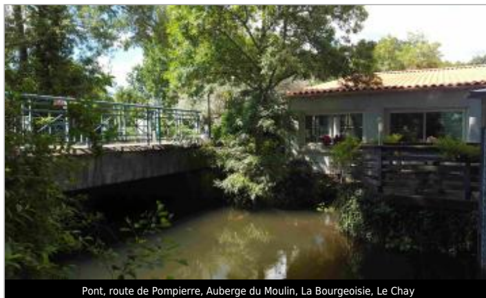
Pont, route de Pompierre, Auberge du Moulin, La Bourgeoisie, Le Chay