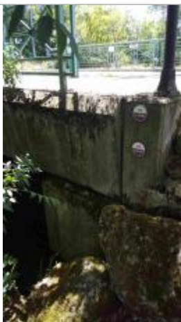
Repère crue 1994, pont route de pompierre

Altitude calculée de l'eau (en m) : 4.36