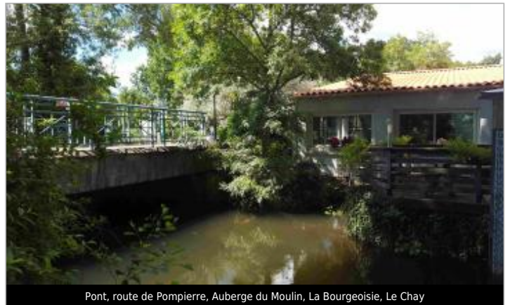
Pont, route de Pompierre, Auberge du Moulin, La Bourgeoisie, Le Chay