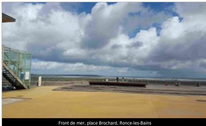
Front de mer, place Brochard, Ronce-les-Bains

Coordonnées WGS84 : X: -1.16501840 / Y: 45.79958530