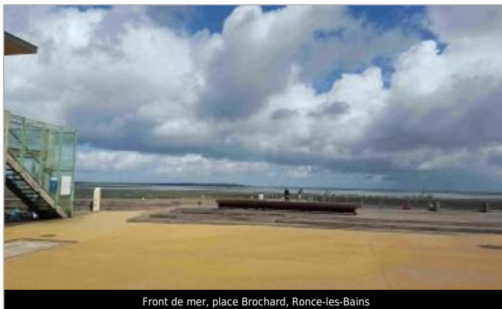
Front de mer, place Brochard, Ronce-les-Bains