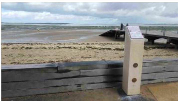
Repère de submersion Xynthia - Place Brochard, Ronce-les-Bains