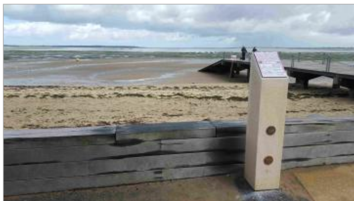
Repère de submersion Xynthia - Place Brochard, Ronce-les-Bains