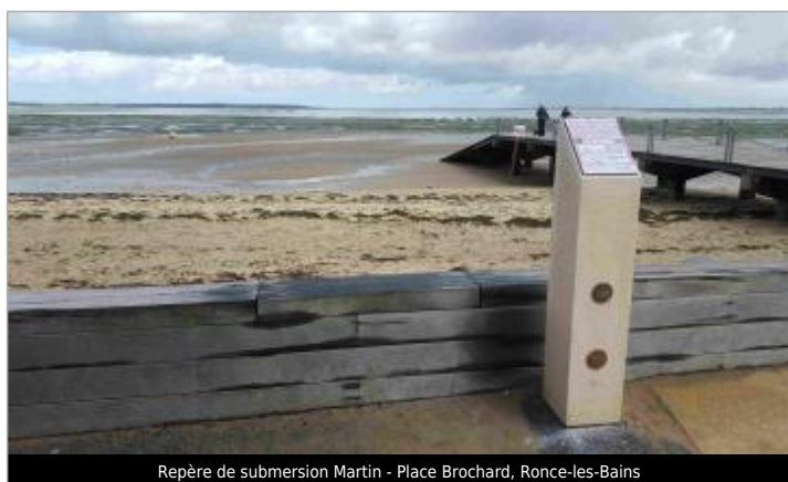
Repère de submersion Martin - Place Brochard, Ronce-les-Bains