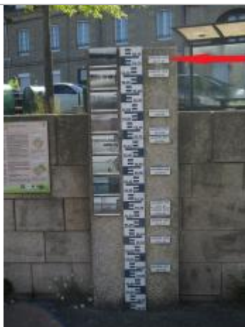
Totem des repères de crues, quai Niemen

Altitude calculée de l'eau (en m) : 56.11 m