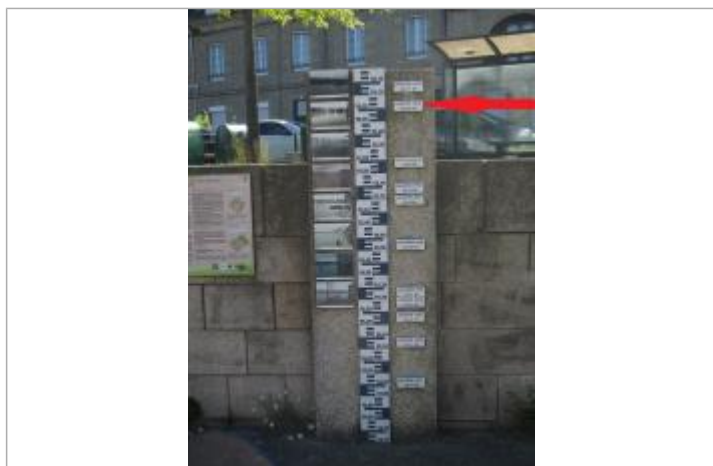
Totem des repères de crues, quai Niemen

Altitude calculée de l'eau (en m) : 56.04 m