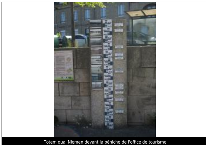
Totem quai Niemen devant la péniche de l'office de tourisme