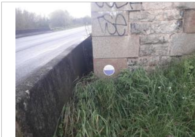
Pile de Pont SNCF

Coordonnées WGS84 : X: -0.51259850 / Y: 47.51054060