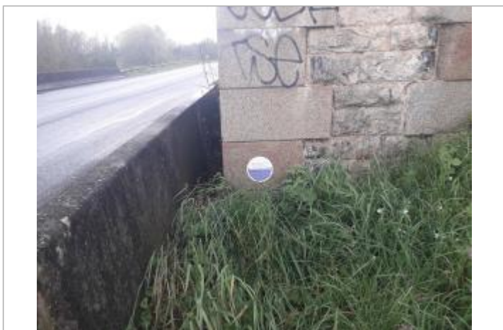
Sur pile de Pont SNCF

MARQUE Visibilité : Oui État du repère : Bon