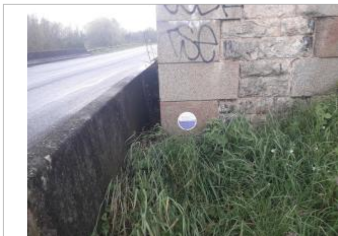
Sur pile de Pont SNCF

Système altimétrique : NGF IGN 1969 (système normal)