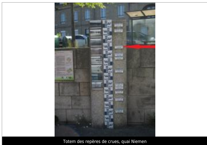
Totem des repères de crues, quai Niemen

Altitude calculée de l'eau (en m) : 55.82 m