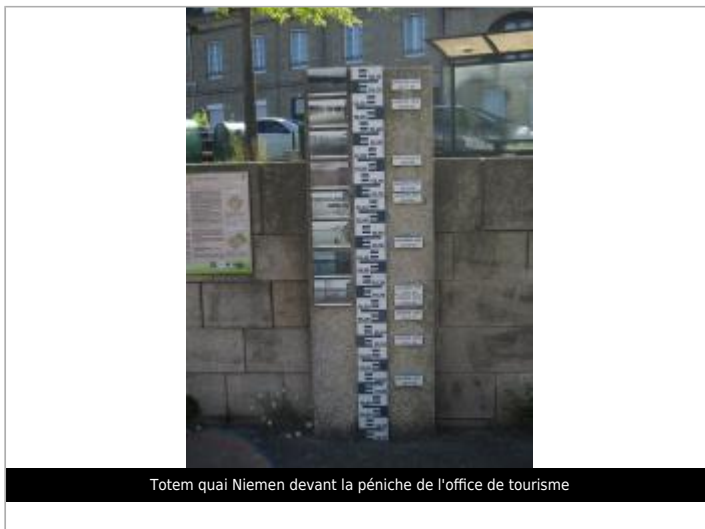
Totem quai Niemen devant la péniche de l'office de tourisme