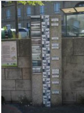
Totem quai Niemen devant la péniche de l'office de tourisme