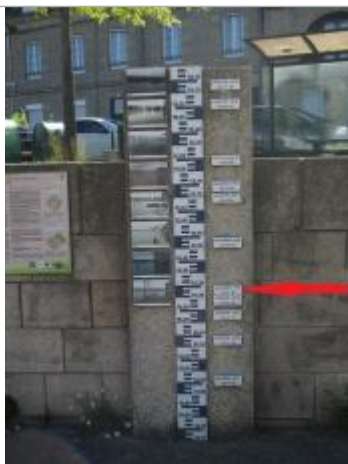
Totem des repères de crues, quai Niemen

Altitude calculée de l'eau (en m) : 55.31 m