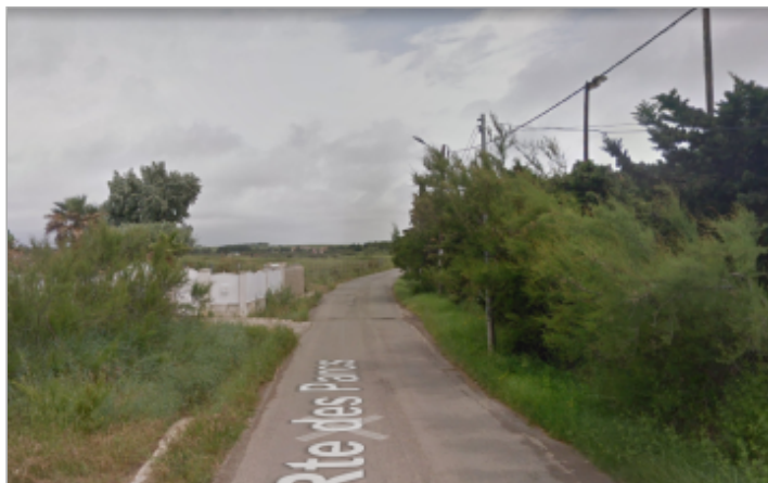
Vue depuis l'accès sud