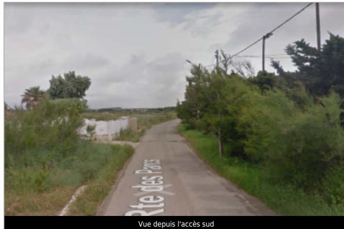
Vue depuis l'accès sud