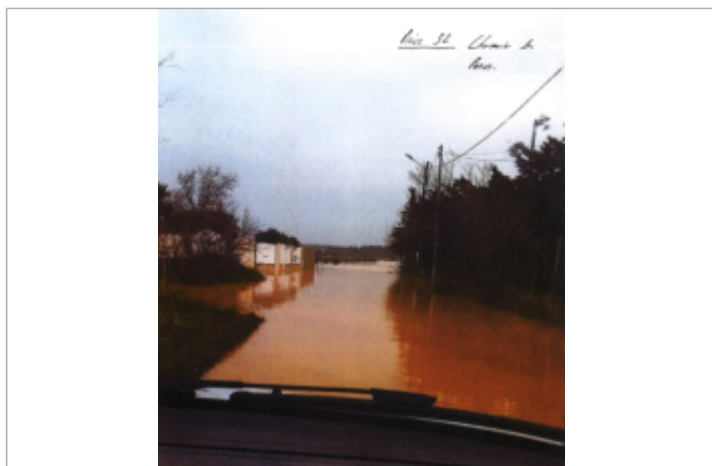
Route depuis l'accès sud et premières habitations

Altitude calculée de l'eau (en m) : 1.2 m