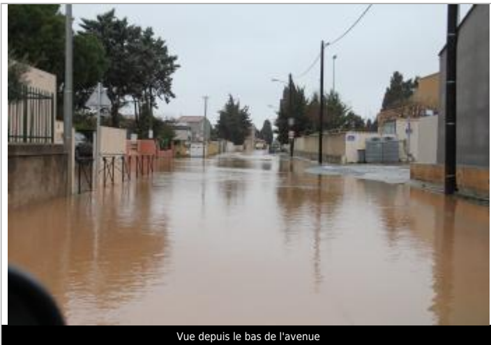
Vue depuis le bas de l'avenue

Altitude calculée de l'eau (en m) : 6.05 m