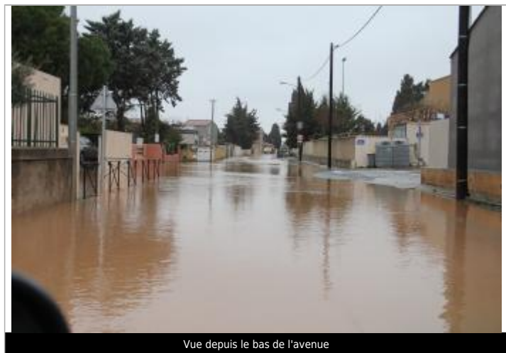
Vue depuis le bas de l'avenue

Altitude calculée de l'eau (en m) : 6.05