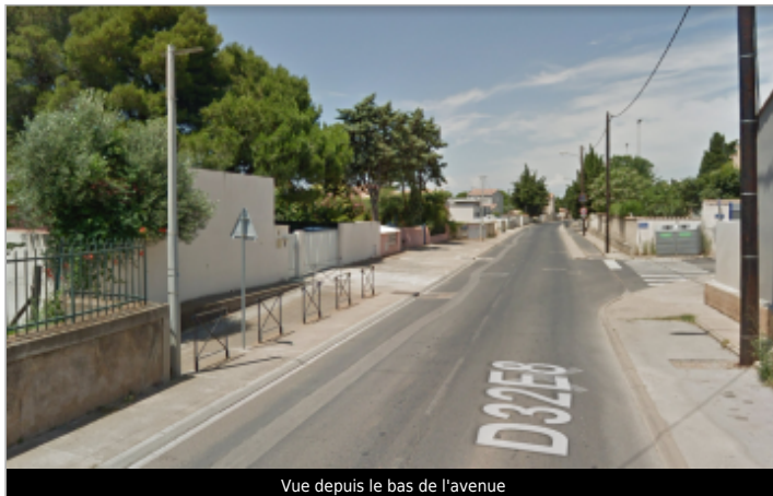
Vue depuis le bas de l'avenue