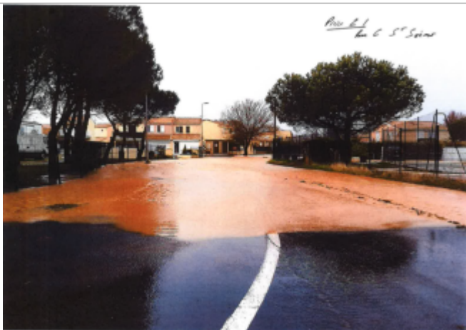
Rue depuis la Promenade de la Belle Scribote

Altitude calculée de l'eau (en m) : 1.35