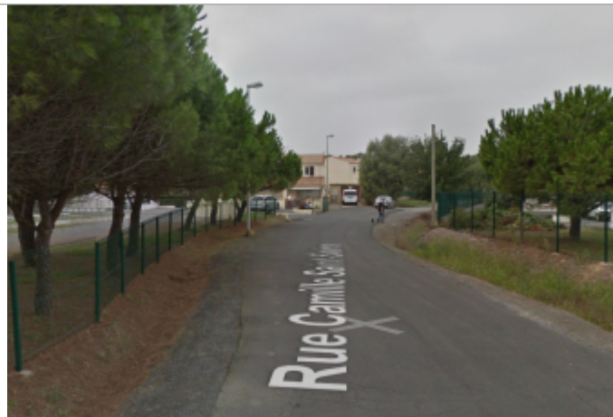
Vue de la rue depuis la Promenade de la Belle Scribote

Coordonnées WGS84 : X: 3.53067400 / Y: 43.34636000