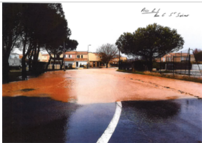
Rue depuis la Promenade de la Belle Scribote

Altitude calculée de l'eau (en m) : 1.35