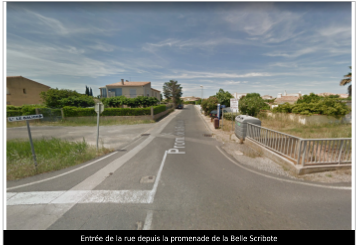
Entrée de la rue depuis la promenade de la Belle Scribote