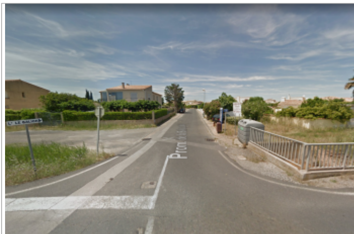
Entrée de la rue depuis la promenade de la Belle Scribote