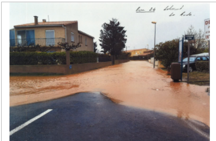
Vue de la rue depuis la Promenade de la Belle Scribote