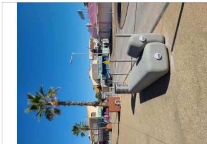
Repère de crue posé sur le mobiliser urbain

Altitude calculée de l'eau (en m) : 1.05 m