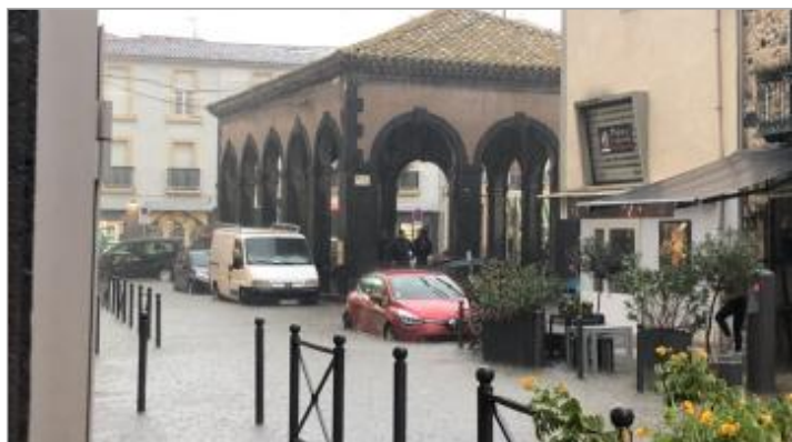
Place Carnot depuis la rue Général de Gaulle