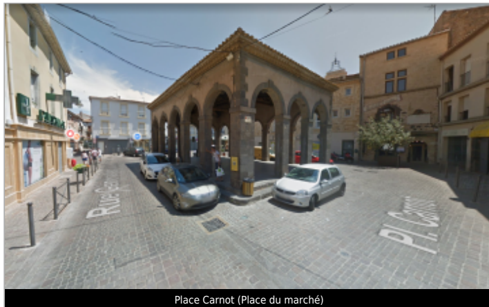
Place Carnot (Place du marché)