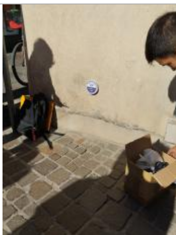
Pose du repère de crue

Altitude calculée de l'eau (en m) : 2.4 m