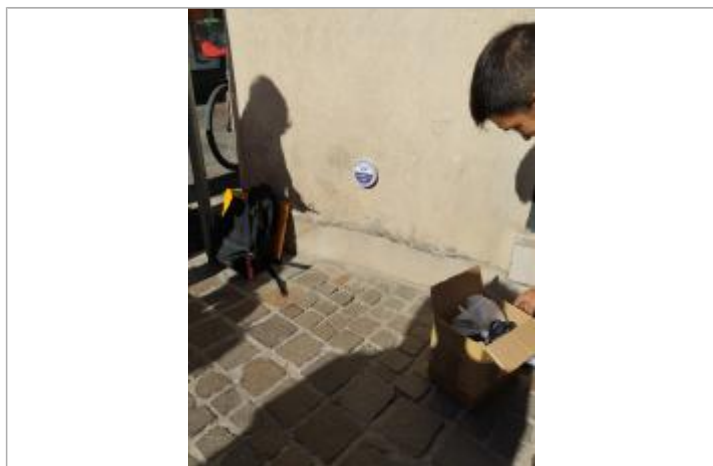
Pose du repère de crue

Altitude calculée de l'eau (en m) : 2.4 m