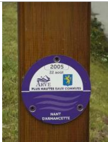
crue du 22/8/2005 du Nant d'Armançette