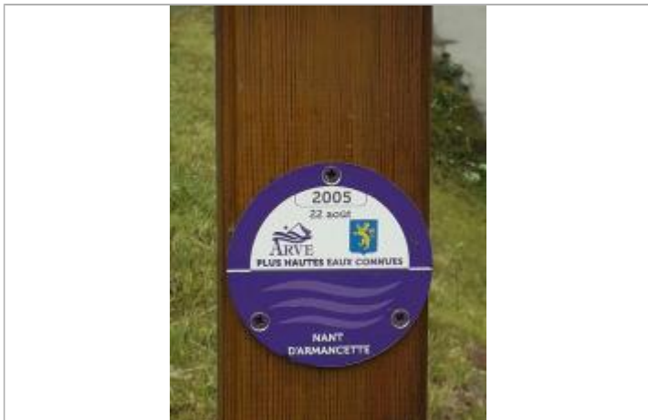
crue du 22/8/2005 du Nant d'Armançette