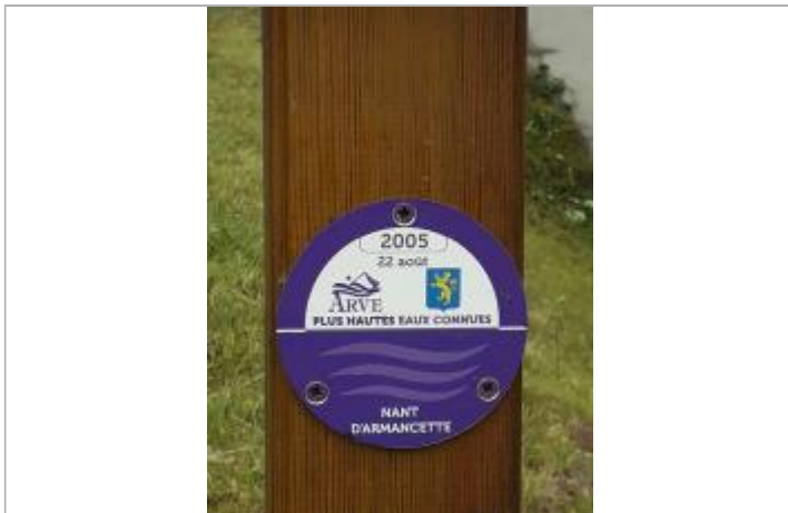
crue du 22/8/2005 du Nant d'Armançette