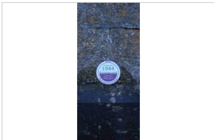
Repère de crue 26 novembre 1944