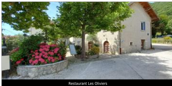
Restaurant Les Oliviers