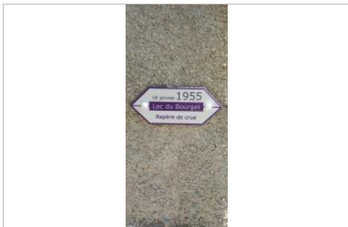
Repère de crue 18 janvier 1955