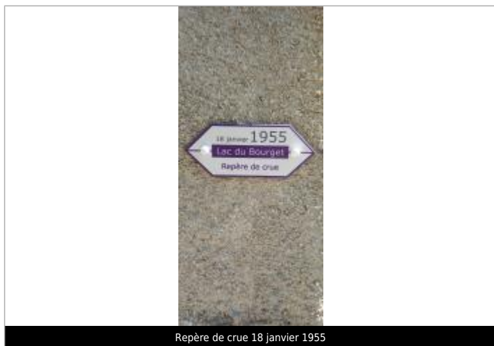
Repère de crue 18 janvier 1955