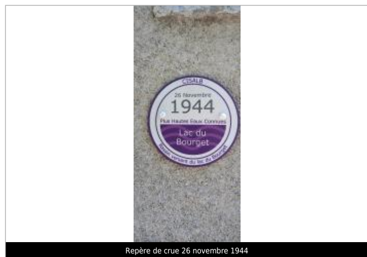
Repère de crue 26 novembre 1944