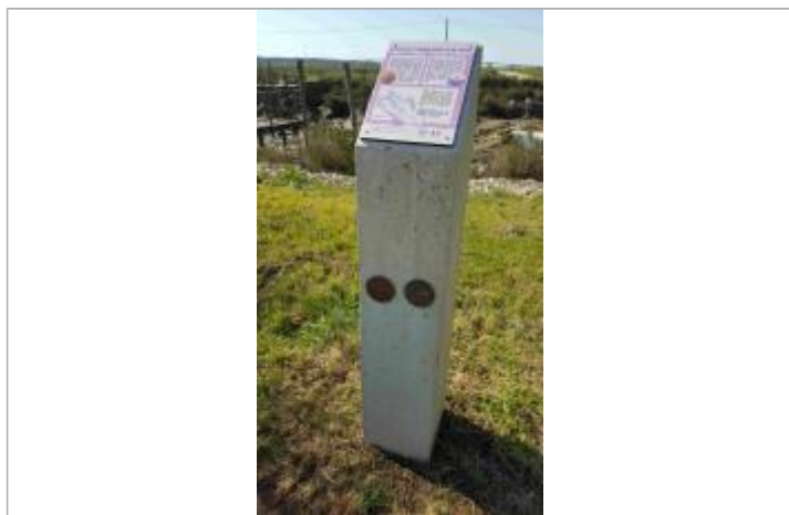
Repère de submersion Martin - Chenal de Marennes