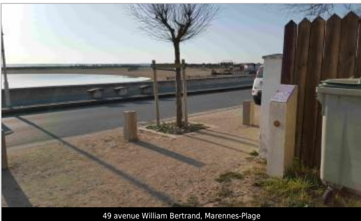
49 avenue William Bertrand, Marennes-Plage

GÉOLOCALISATION Coordonnées WGS84 : X: -1.13640030 / Y: 45.81889800 Coordonnées RGF93 (Lambert 93) X: 378965.13 / Y: 6532772.94 Coordonnées RGF93 (ETRS89) : X: -1.1364003 / Y: 45.818898 Code Hydro: S01-0400 Rive de référence: Droite