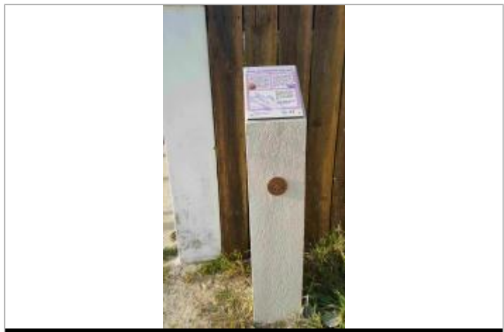
Repère Xynthia, 49 rue William Bertrand, Marennes-Plage

GÉNÉRAL Code : SMBS_R_17_01 Date de mise à jour : 04/07/2022 Auteur : PAPI Seudre