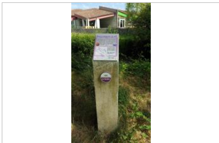
Repère crue 1982, allée de la taillée verte