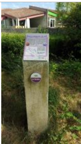
Repère crue 1982, allée de la taillée verte

Texte : 1982 - Niveau atteint par les eaux - La Seudre