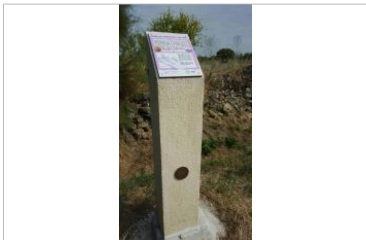
Repère Xynthia à Souhe

Code : SMBS_R_14_01 Date de mise à jour : 01/07/2022 Auteur : PAPI Seudre