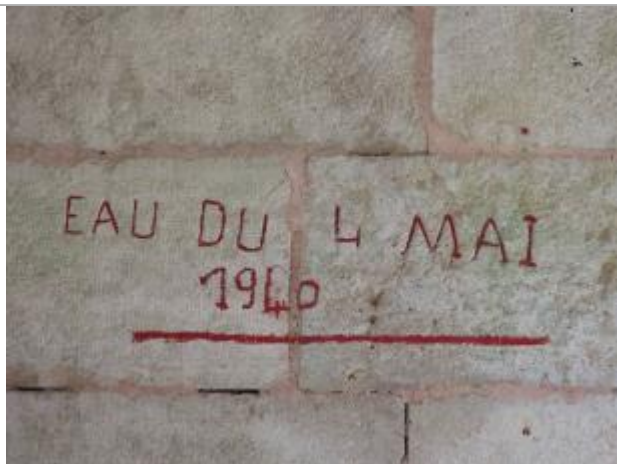
Marque gravée sur le mur sud ouest