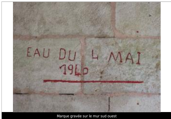
Marque gravée sur le mur sud ouest