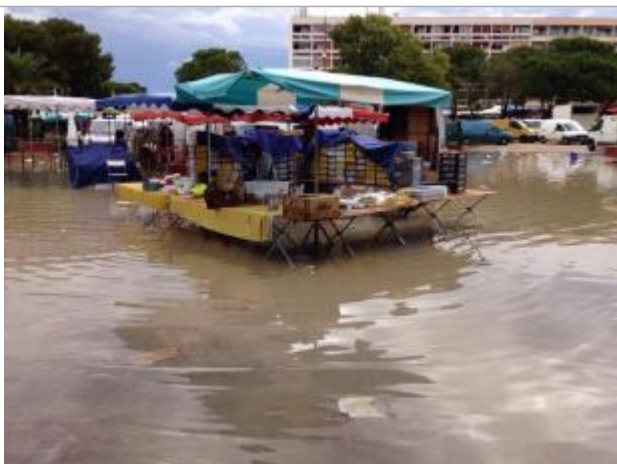
Place du marché au cœur du parc

Altitude calculée de l'eau (en m) : 1.4 m