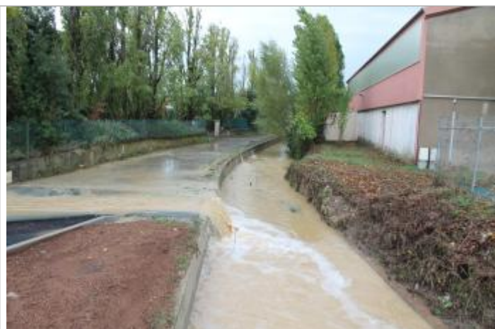
Chemin du passage d'étang en post-crue #1

Altitude calculée de l'eau (en m) : 42.8 m