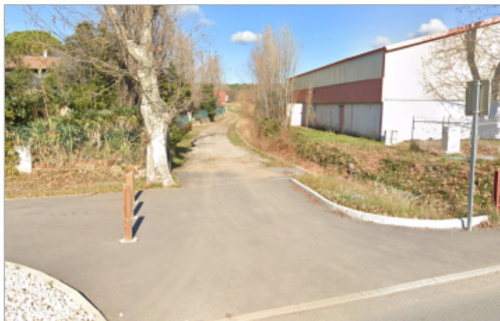
Chemin depuis la route de Montagnac