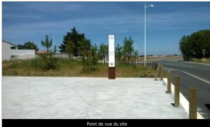
Point de vue du site