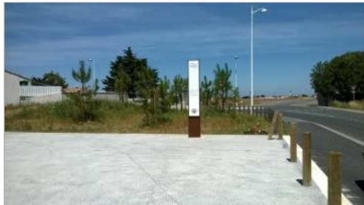
Point de vue du site