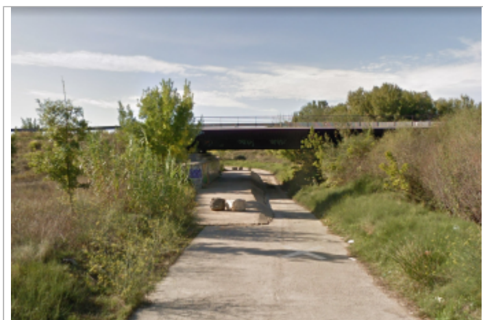
Pont vu depuis le nord, la Vène est à droite (vers l'aval)

GÉOLOCALISATION Coordonnées WGS84 : X: 3.69850020 / Y: 43.49496900 Coordonnées RGF93 (Lambert 93) X: 756519.78 / Y: 6266459.19 Coordonnées RGF93 (ETRS89) : X: 3.6985002 / Y: 43.494969 Code Hydro: Y3020500 Rive de référence: