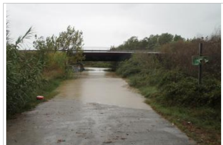
Pont vu depuis le chemin côté nord #2

SOURCE DE REPÉRAGE : ÉTUDE DES PHE DU TERRITOIRE DE THAU PAR LE SMBT (2021/22) - Type de repérage : Campagne de terrain post-inondation