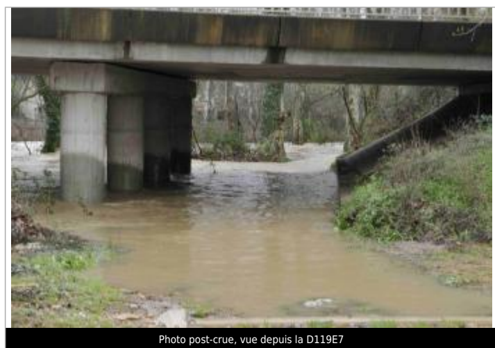
Photo post-crue, vue depuis la D119E7

Maximum de l'inondation : Oui Visibilité : Oui