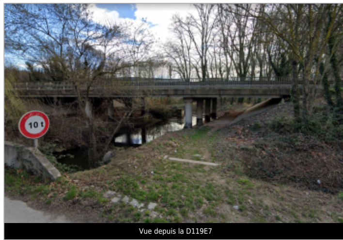
Vue depuis la D119E7