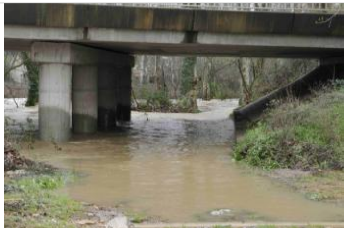
Photo post-crue, vue depuis la D119E7

Altitude calculée de l'eau (en m) : 11.8 m