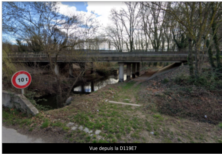
Vue depuis la D119E7