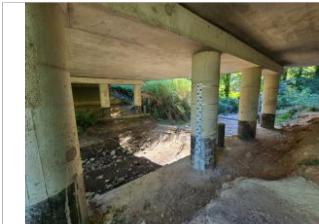
Passage piéton sous le pont