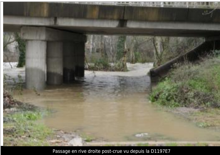
Passage en rive droite post-crue vu depuis la D1197E7

Altitude calculée de l'eau (en m) : 11.8