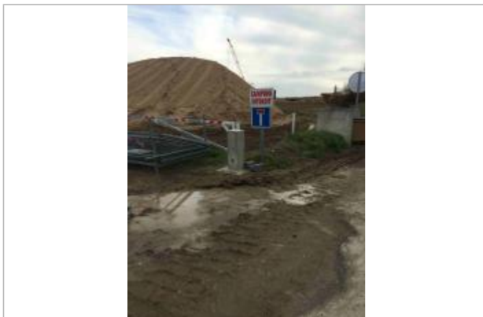
Point de vue du site