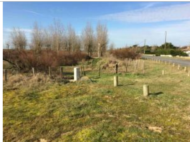
Point de vue du site