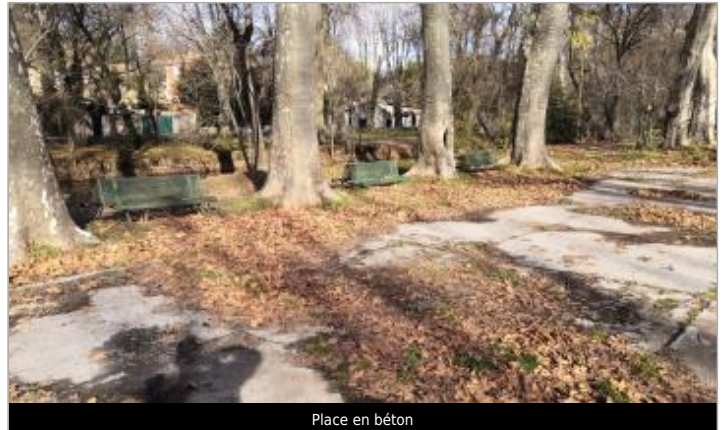
Place en béton

Coordonnées WGS84 : X: 3.69720090 / Y: 43.47807300