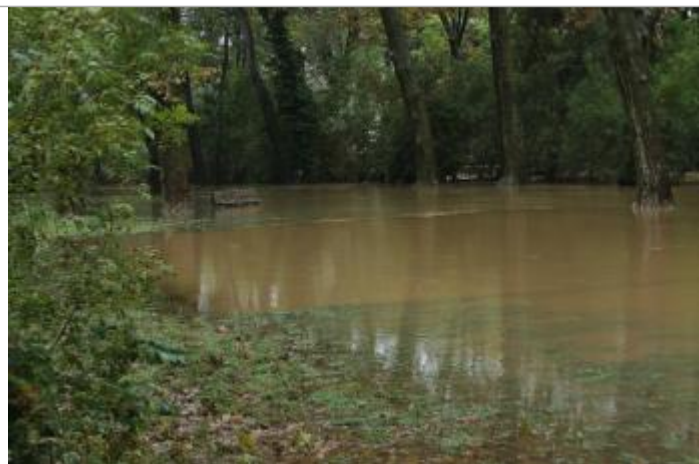
Place durant la décrue

Altitude calculée de l'eau (en m) : 10.7 m