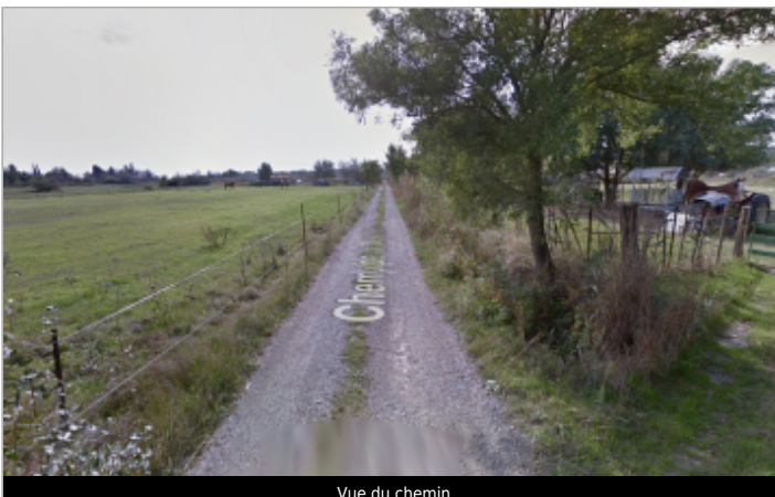
Vue du chemin

GÉOLOCALISATION Coordonnées WGS84 : X: 3.67479290 / Y: 43.46671200 Coordonnées RGF93 (Lambert 93) X: 754628.37 / Y: 6263301.87 Coordonnées RGF93 (ETRS89) : X: 3.6747929 / Y: 43.466712 Code Hydro: Y3020500 Rive de référence: