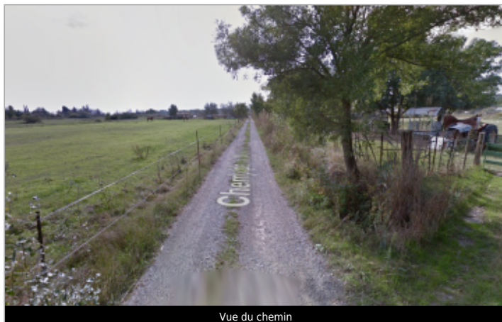
Vue du chemin

Coordonnées WGS84 : X: 3.67479290 / Y: 43.46671200